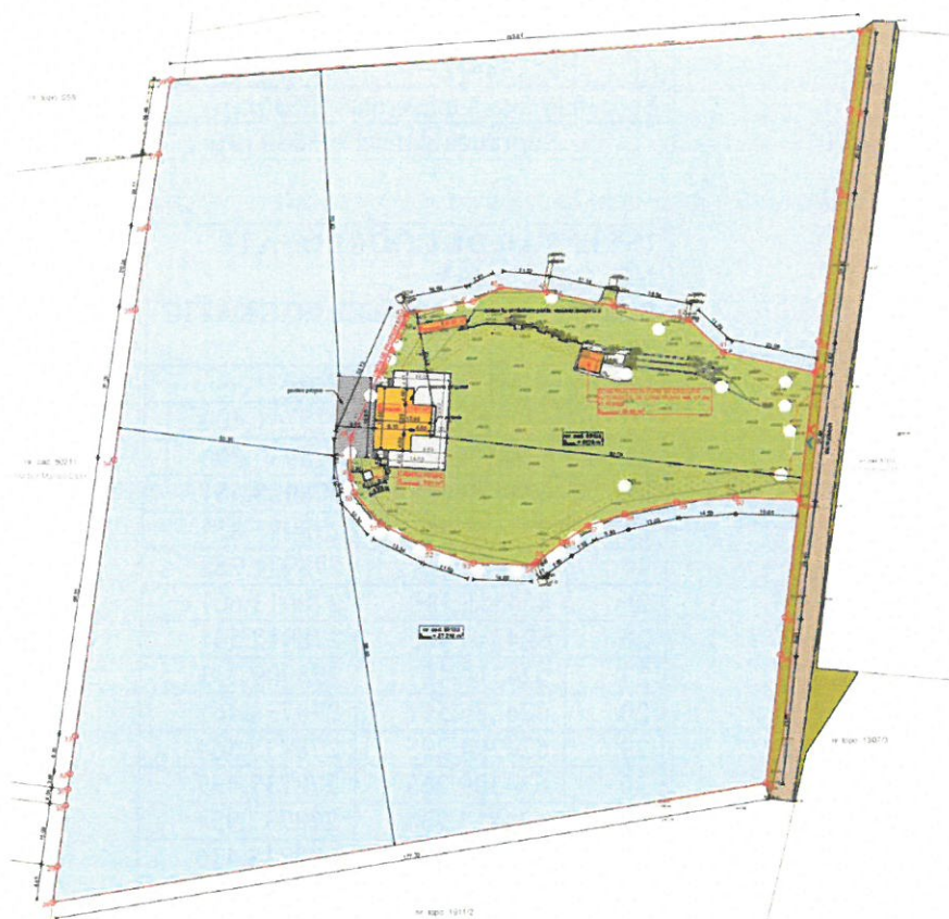
Plan de situație

- coordonatele geografice ale amplasamentului proiectului, care vor fi prezentate sub formă de vector în format digital cu referință geografică, în sistem de proiecție națională Stereo 1970;