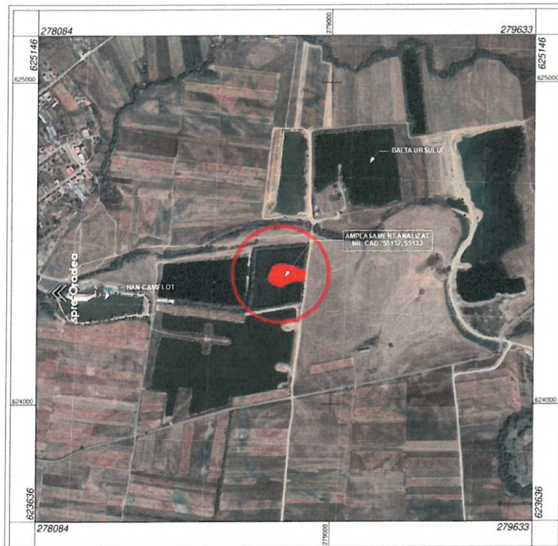
Plan de încadrare în zonă