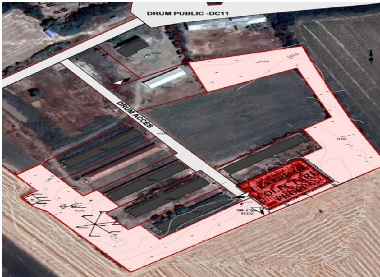
Plan de încadrare în zonă

Zona aparține structurii geologice majore depresionare a Câmpiei Panonice, în care succesiunea geologică este dată de complexul argilelor și nisipurilor panoniene de culoare cenușiu vineție, peste care se dispun discordant formațiuni recente, nisipuri și pietrișuri de terasă, formațiuni aluvionare argiloase-nisipoase, de vârstă Pleistocen-Holocene.