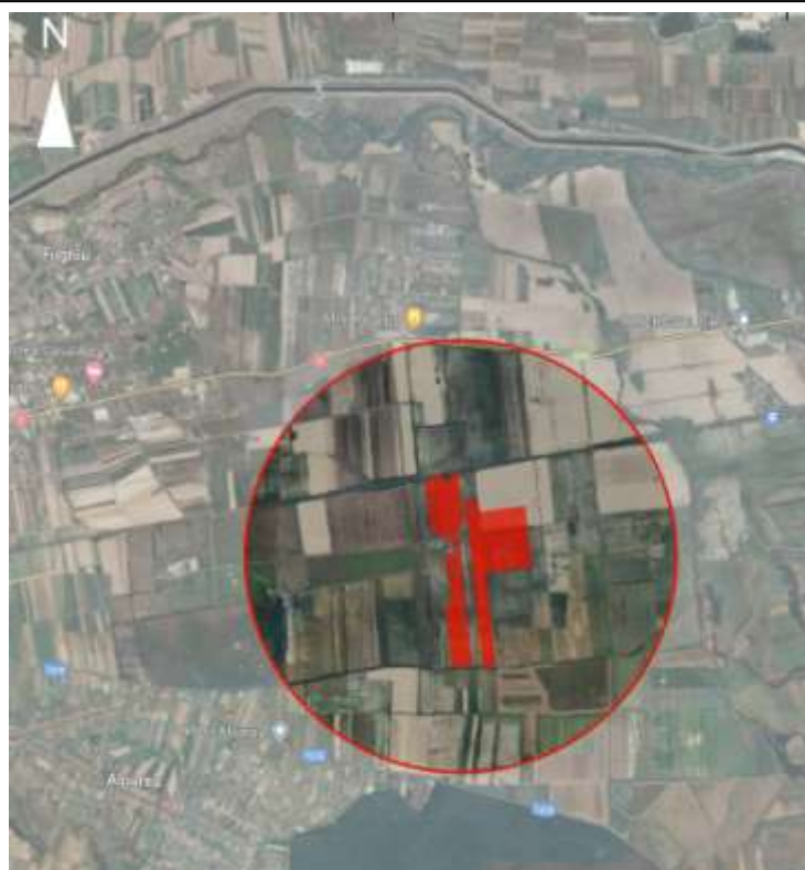
Figura 2. Amplasamentul proiectului