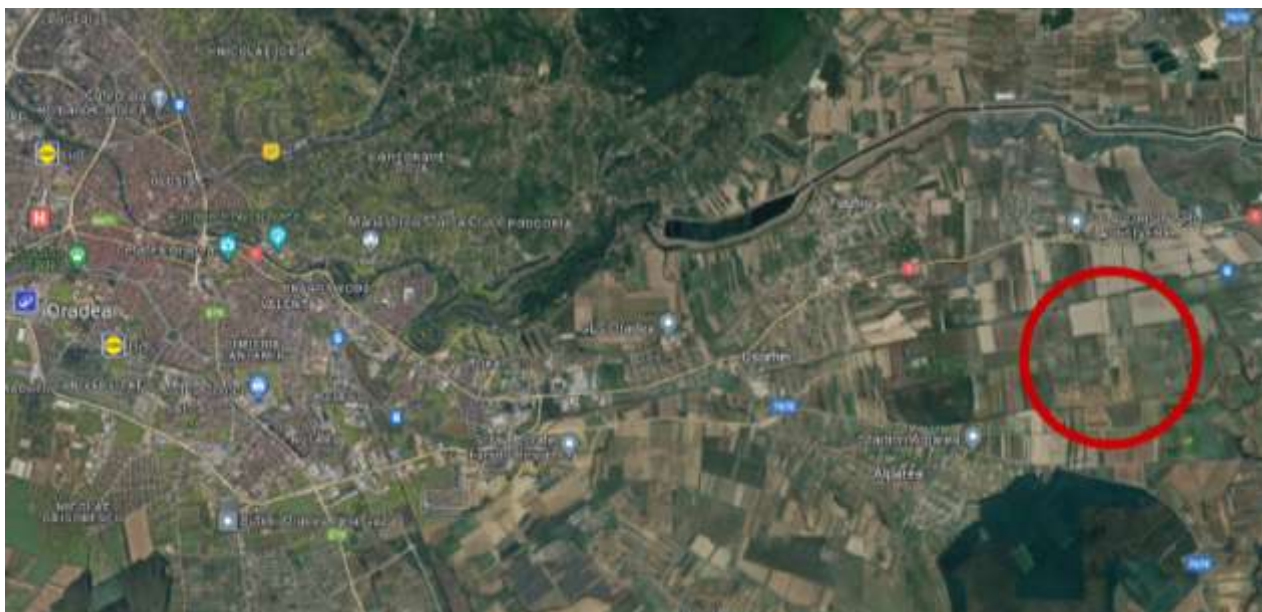
Figura 1. Amplasamentul proiectului

De asemenea proiectul propune amplasarea și instalarea unor panouri fotovoltaice pe o suprafata de 342 987.65 m 2 . Functionarea acestor panouri se bazează pe transformarea fluxului luminos în energie electrică continuă, care este transformată cu ajutorul unui inverter în energie alternativa și este livrată în instalatia de utilizare a consumatorului și în rețeaua electrică de distributie.